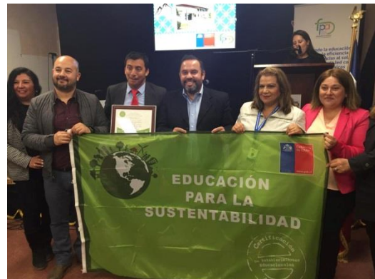
Actividades de Educación Ambiental y Participación Ciudadana.